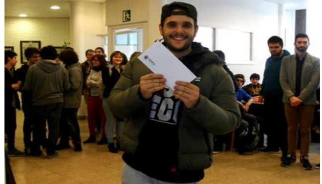
Ikasle eta ekintzaile gazte sarituetako batzuk