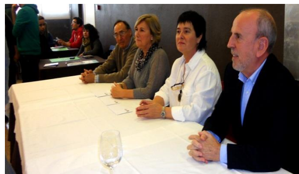
Aholkulariek, hezitzaileek eta enpresek eratutako epaimahaia.