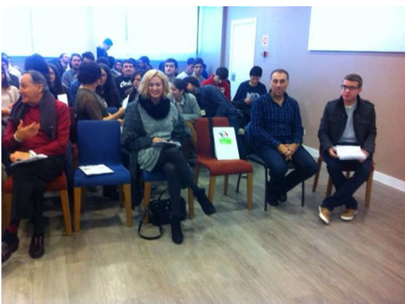
Εκπαίδευση μεντόρων στην πράξη

«Έχω εκτιμήσει ιδιαίτερα την ευκαιρία που μου δόθηκε να βοηθήσω νέους επιχειρηματίες να συνειδητοποιήσουν τις φιλοδοξίες τους. Το πρόγραμμα κατάρτισης mentoring με βοήθησε πάρα πολύ στην υλοποίηση της διαδικασίας, σχετικά με το πώς να καθοδηγήσω και να στηρίξω νέους εν δυνάμει επιχειρηματίες. Ορισμένες από τις επιχειρηματικές ιδέες που παρουσιάστηκαν είναι πραγματικά αξιόλογες και έχουν καλές προοπτικές για μελλοντική ανάπτυξη και εξέλιξη - ελπίζω να αποτελέσω μέρος αυτής της διαδικασίας στο μέλλον και χαιρετίζω την ευκαιρία που μου δόθηκε να βοηθήσω άλλους ανθρώπους»